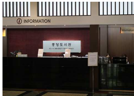
[ Information Center ]