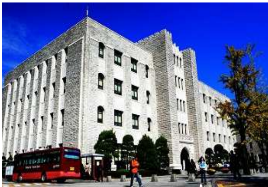
[ 中央图书馆 ]